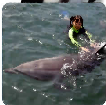
ドルフィンスイム