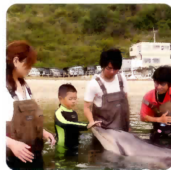
触れ合いピー子体験